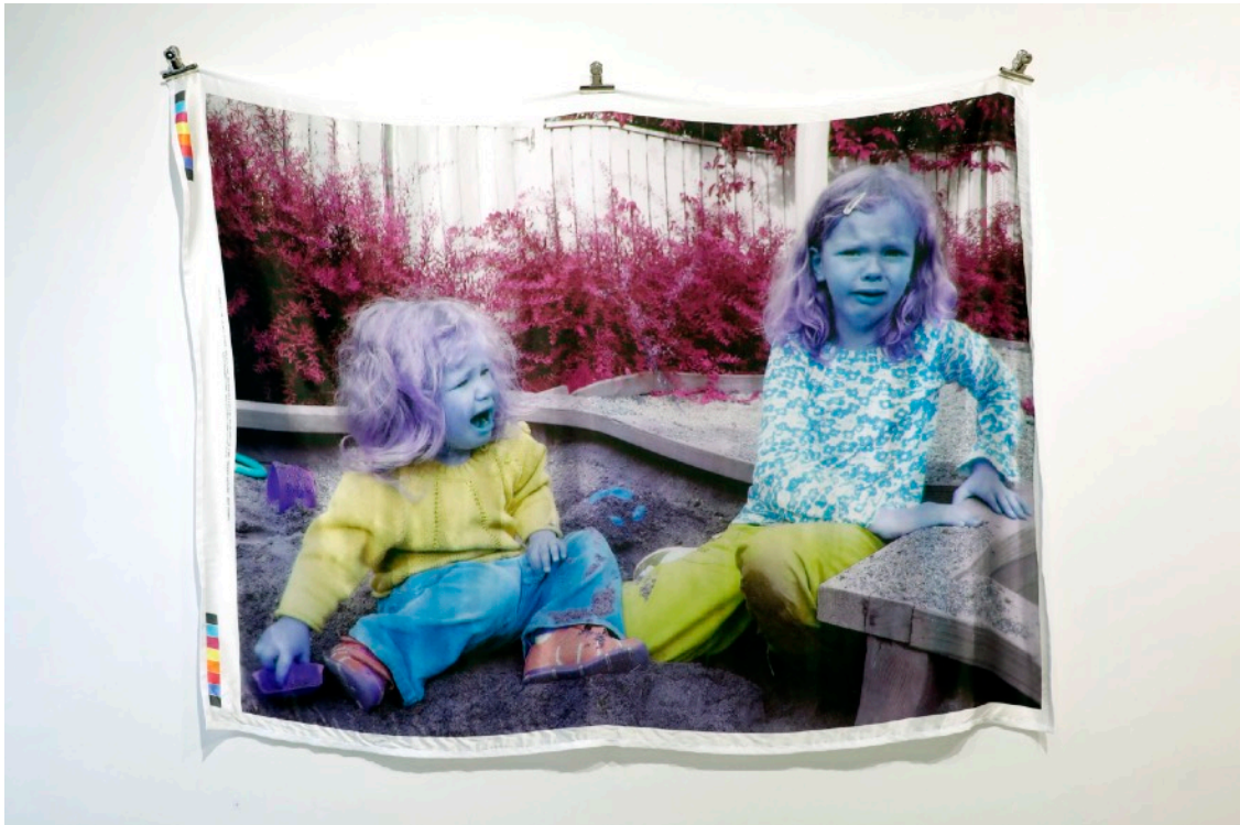
Paha kakku I , 120cm x 183cm, valokuvatuloste kankaalle, 2007-2022