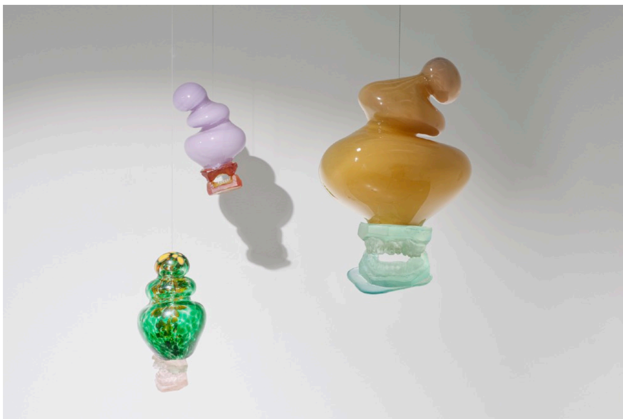
Hammasoliot, valettu ja puhallettu lasi, n. 22cm x 40cm/ kpl, 2022