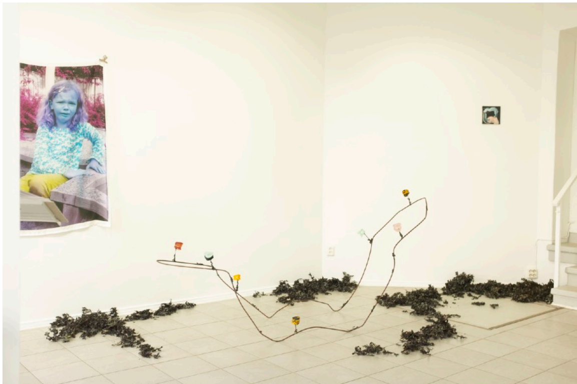
Vuorovesi , lasi, harjateräs ja rakkolevä, 5m x 1,2m x 3m, 2022