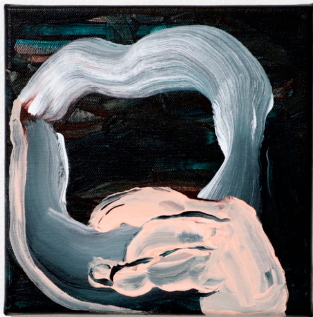
I am sound me! , akryyli kankaalle, 20cm x 20cm, 2020