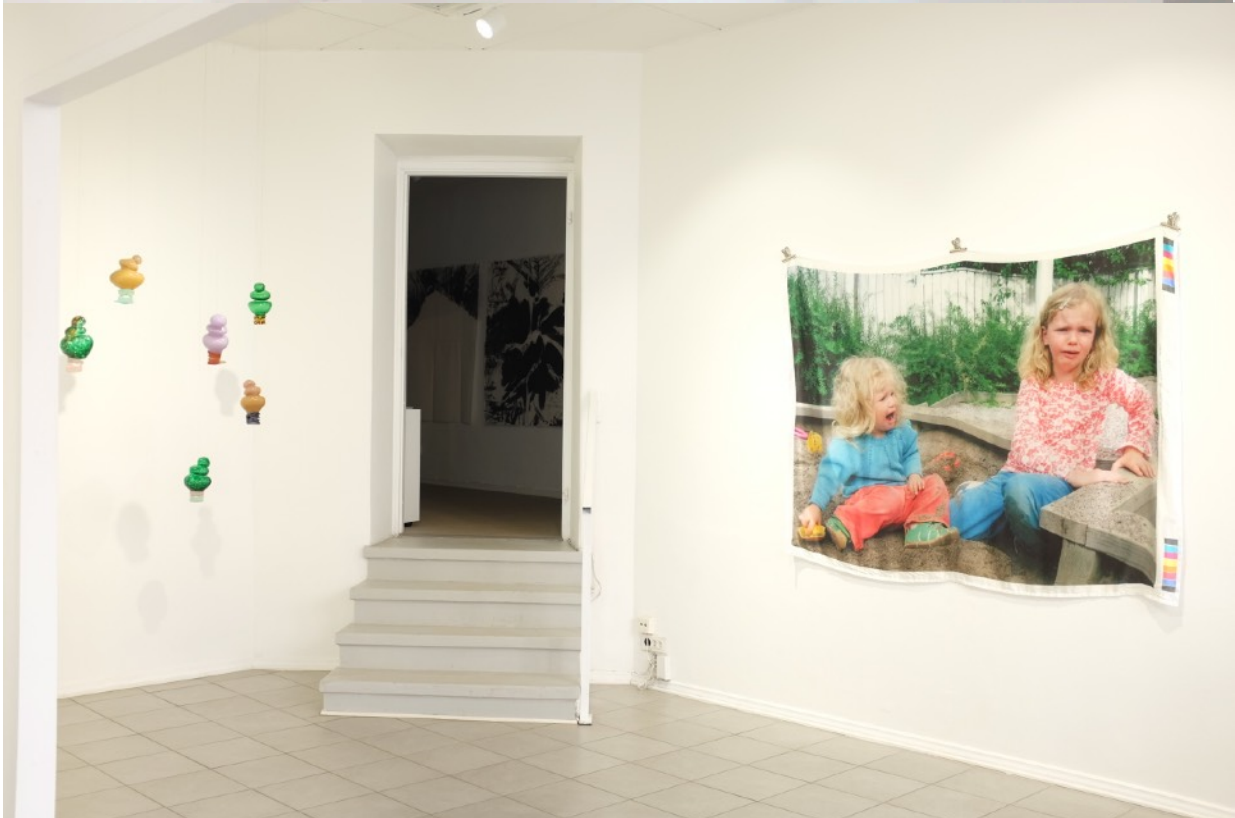
Kuva näyttelyriipustuksesta Medeia M(others). Esillä teokset “Paha kakku II” ja “Hammasoliot”.